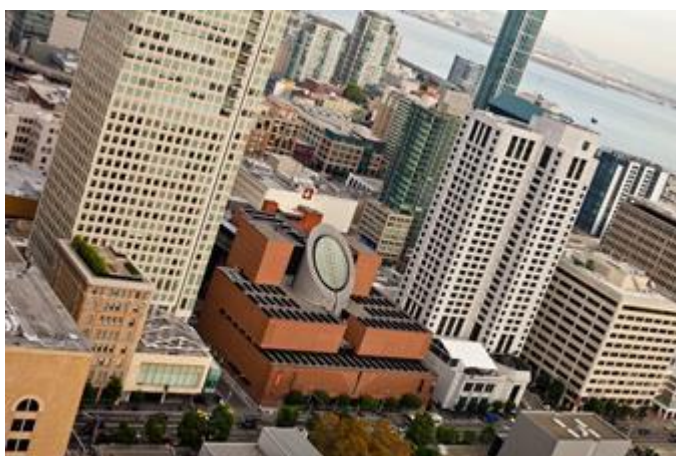
Luffoto af San Francisco Museum of Moderne Art.